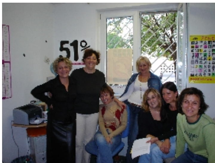
radionica: Ženska seksualnost, Domine, Split, listopad 2004.

(20 milijuna kn od države za alimentacije, Jutarnji list, 26.02.2004.)